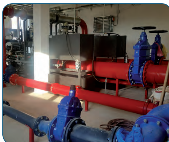
Motopompa tipo "vertical turbine pump" insonorizzata, realizzata secondo UNI EN 12845 Soundproof Fire fighting Diesel motor pump with "vertical turbine pump", made according to standard EN 12845 Motobomba Diesel contra incendio insonorizada con "vertical turbine pump", realizada en acuerdo de EN 12845